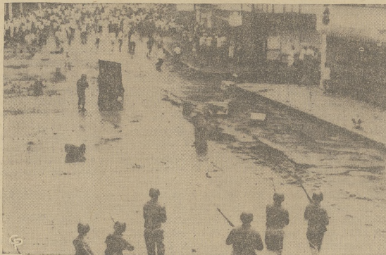
Podczas rozruchów studentów w Panamie, policja oczekiwiała z bronią w pogotowiu, przed sklepami, obrabowanymi przez buntowników, którzy zrobili zamieszanie w całym mieście.