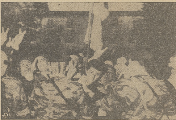
Podczas zaburzeń na Korsyce, odbyła się masowa demonstracja przed budynkiem policji w Ajaccio.