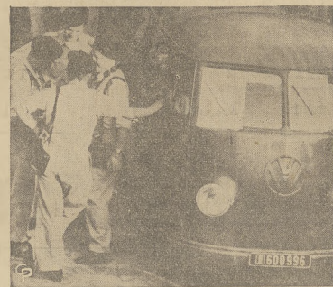
Francuscy żołnierze w Algierze, zgromadzeni przy wojskowej ciężarówce entuzjastycznie wypowiadają się za Gen. de Gaulle, żądając by objął rząd w państwie.