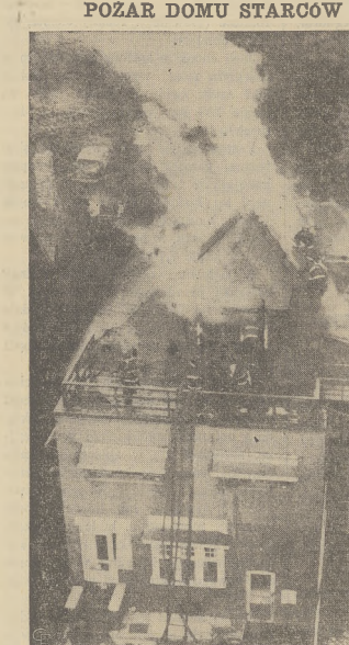
W pożarze domu starców, jaki miał miejsce w Toronto, Ont., dwoje starszysów utraciło życie, a 10 odniosło rany. Pożar wybuchł na górnych piętrach budynku.