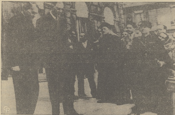
Gen. de Gaulle, widoczny jest w towarzystwie prezydenta Francji Rene Coty (na lewo) po wyjściu z Pałacu Elizejskiego w Paryżu, gdzie Generali zgromadził się obić stanowisko premiera i przez dyscyplinę wojskową ma zaprowadzić porządek w rządzie.