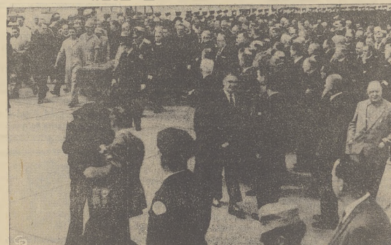
Trumna ze zwłokami Kardynała Stritcha przybyła z Rzymu do Chicago i zostanie wystawiona w Katedrze św. Imienia na widok publiczny. Pogrzeb wysokiego dostojnika Kościoła ma odbyć się jutro.