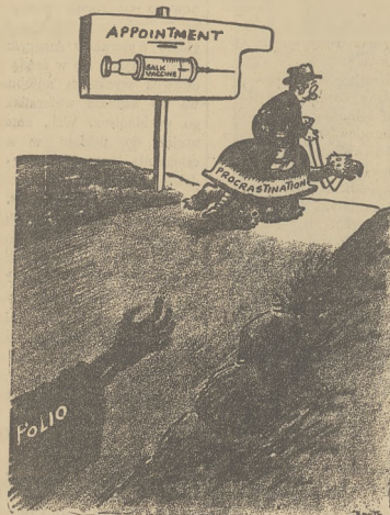
The Miami Herald

Rozsądny strach było bardzo dobry. Strach często powstrzymuje ludzi od zbytecznego ryzyka. Powoduje akty samobrony w razie gdy jesteśmy zaatakowani. Reakcja na strach niejednokrotnie wydała wspaniałe osiągnięcia dla dobra całej ludzkości.