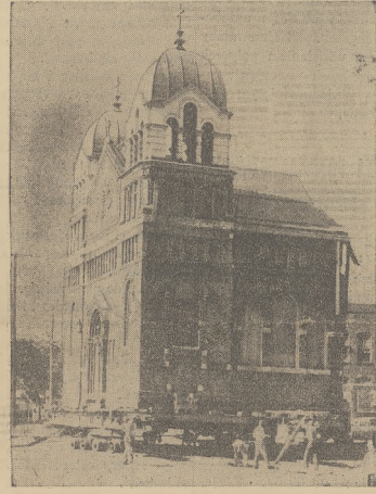
Na zdjęciu jest widoczna akcja przewożenia kościoła prawosławnego w miejscowości Canton, O. Na górnym zdjęciu jest widoczne rozpo-

łała w walizce do Memphis, Tenn. Ponieważ prokurator nie zdołał zebrać żadnych dowodów i musiał opierać się na zeznaniach pielęgniarki, która twierdzi iż działała w samoobronie, musiano ją uniewinnić.