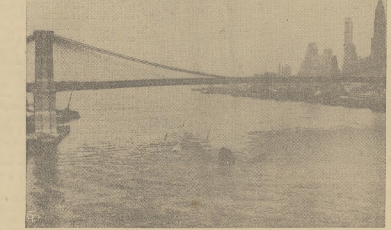
Zdjęcie przedstawia miejsce, w którym zatonął amerykański statek-cysterna "Empress Bay", pod mostem Brooklyn, po zderzeniu się ze szwedzkim okrętem towarowym "Nebraska".