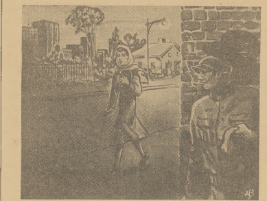
Kobieta która może pozwolić sobie na towarzystwo drugiej osoby (czyli może być mężczyzną) nie powinna wieczorem wychodzić sama z domu, bo nie wiadomo co kryje się w ciemnych zaułkach.