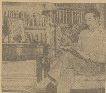
Gen. Rafael Trujillo, Jr., czyta książkę w kabinie swojego jachtu. Obok na stole stoi zdjęcie artystki filmowej Kim Novak.