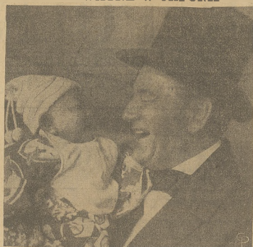
John Wayne był w Japonii, gdzie nakręcał film. Na zdjęciu jest on widoczny z dzieckiem japońskim w jednej ze scen tego filmu.