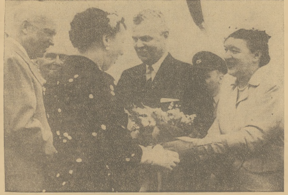
Prezydent Eisenhower wraz z żoną przybyli do Ottawy, gdzie p. Eisenhower otrzymała bukiet kwiatów od pani John Diefenbaker, żony premiera Kanady. Wizyta pp. Eisenhower w Kanadzie ma trwać trzy dni. Prezydentowi towarzyszy Sekretarz Stanu, John Foster Dulles z małżonką.