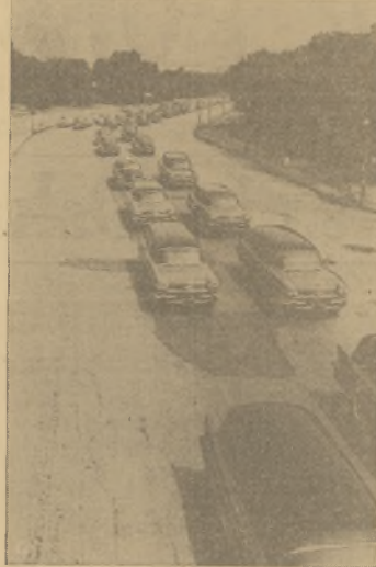
Zdjęcie przedstawia 40 pogrzebowych samochodów, które były ściągane do Chicago przed tym lypcem w związku z wypadkami przewidywanymi z powodu wzmożonego ruchu drogowego.