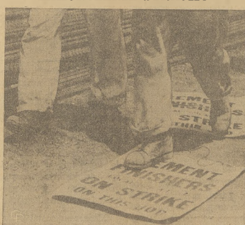
Miesięczny strajk robotników budowlanych w Pittsburghu zakończył się. 8,000 robotników wróciło do przerwanej pracy.