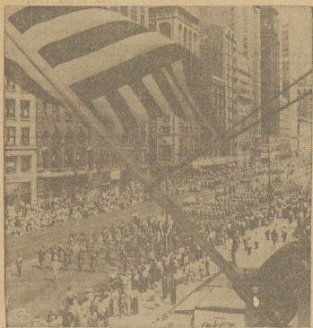
W Chicago na Michigan Ave. organizacja "Shrines" narażająca pochód z udziałem 18,000 członków.