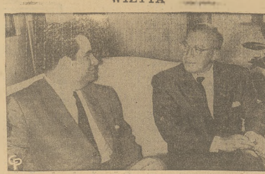
Dr. Milton Eisenhower (z prawej), brat Prezydenta Eisenhowera, składa wizytę prezydentowi Nikaragui, republi-