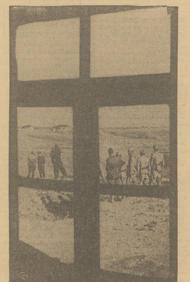
Pilnym okiem Turcy śledzą każdy ruch po drugiej stronie turecko-rosyjskiej granicy. W oddali widoczne są strażnice rosyjskie.

matów tereny łowieckie i rybackie w odległości 80 mil od Moskwy.