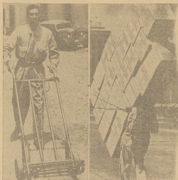
Dzisiaj portrzy w Mexico City (na lewo) mają prace ułatwioną przy pomocy wózków. Jeszcze do niedawna zmuzeni byli nosić ciężary na plecach (zdjęcie na prawo).