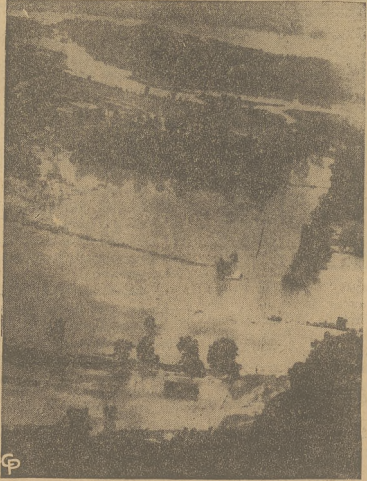
Wzbrana rzeka Missouri załaza szerokie obszary pól uprawnych i wyrządziła olbrzymie szkody. W nisko położonych miejscowościach często można napotkać podobny widok. Na zdjęciu widzimy tyko strzechy miejscowości St. Charles, Missouri.