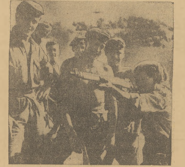
Żołnierz ze słynnego Legjonu Arabskiego próbuje broń brytyjskich spadochroniarzy stacjonujących obecnie w Ammanie, stolicy Jordani.