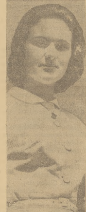
wąjaca obecnie w Anglii na studiach, jest zagrożona w zarobku po swoim narzeczonym młodym królu Feisalu.