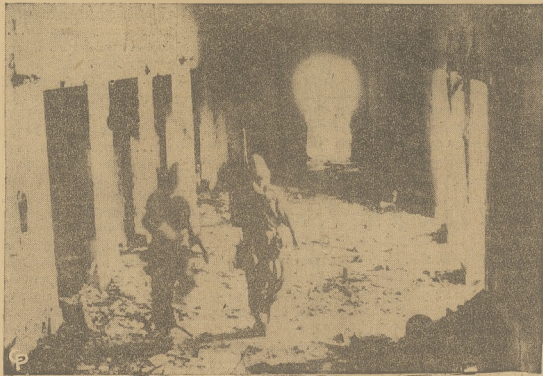
Patrol rebeliantów irackich wśród zniszczenia i pustki w Bagdadzie. Gdy król Fajsal zginął od kul karabinu maszynowego w czasie rewolucji, rebelianci wdarli się do pałacu aby zostawić po sobie pamiątkę ich pobytu.