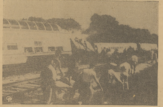
Z sześciu pobliskich miejscowości ambulansy przybyły na pomoc pokaleczonym pasażerom z wykolejonego pociągu "Olympian Hiawatha", należącego do Milwaukee Road Co.