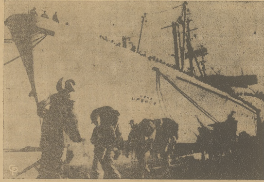
W pełnym uzbrojeniu i wyposażeniu dalszy ciąg Amerykańskich Sił Zbrojnych w sile 1,800 strzelców morskich lądował w Beirucie. Wojska te zostały przerzucone z Zachodnich Niemiec i w skład ich wchodzi dwa bataliony saperów.