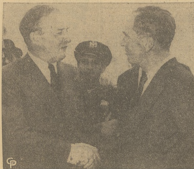
Do New Yorku przybył brytyjski sekretarz Ministerstwa Spraw Zagranicznych, Selwyn Lloyd (z lewej), który ma stanąć na czele brytyjskiej delegacji na specjalną sesję Generalnego Zgromadzenia Narodów Zjednoczonych. Na lotnisku Idlewild, New York, po-