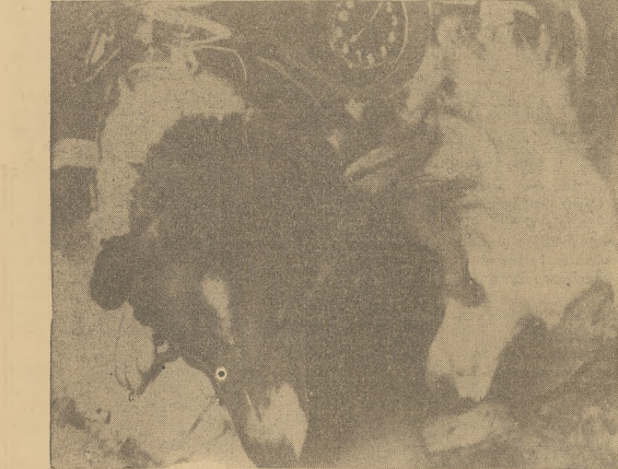
Sowiecka agencja Tass donosi, że zdjęcie psów "Spot" i "Whitey" zrobione było w radiologicznym aparacie fotograficznym, podczas lotu 280 mil nad ziemią w dniu 24 sierpnia i zostało przesłane drogą radiową.