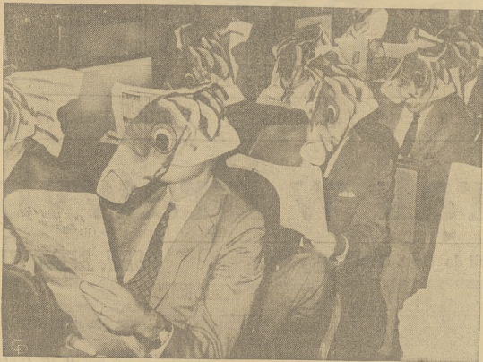
"New York Central" ogłosiła, iż z dniem 12 września wstrzyma kursowanie promu przez rzekę Hudson w mieście Weehawken, N. J.