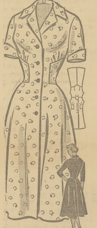
4824 14½-24½ by Anne Adams "Step-in" fason w pół rozmiarach. Drukowane instrukcje.

CENA MODELKA 50 CEN. TÓW. W Kanadzie ze względu na koszty wymiany waluty pięć centów więcej.