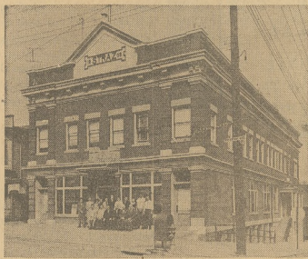
Budynek "Strazy", 1002 Pittston Ave., Scranton, Pa., w którym mieszczą się biura Głównego Zarządu P. N. Spółni

W dniach 20, 21 i 22 września 1958 r., odbywał się będa w Scranton, Pa., uroczystości Złotego Jubileuszu Polsko-Narodowej Spółni.