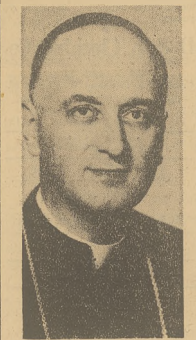
Arcybiskup Albert G. Meyer

Arcybiskup Albert G. Meyer z Milwaukee został mianowany w śróde arcybiskupem miasta Chicago, jako następcę kardynała Samuela Stritcha.