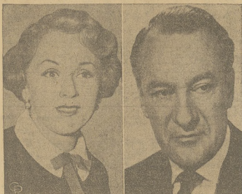
Zgodnie z wiadomością podaną przez dziennikarza Nowo Yorkiego artysta George Sanders zamierza się ożenić z Benią Hume po zmarłym artyście Ronald Coleman.