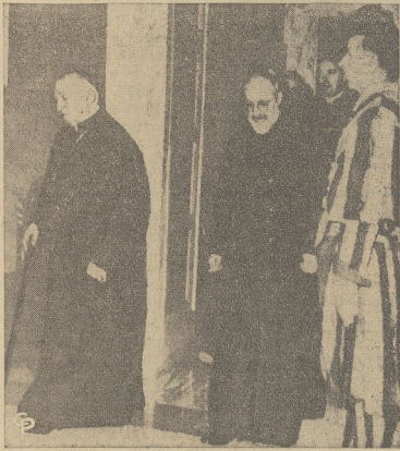
Na zdjęciu z lewej strony jest pokazany Kardynał Clemente Micara i Kardynał Gregoire P. Agagianian, którzy przybyli do letniego pałacu Ojca Świętego. Po zgonie Papięza Kardynał Micara jest czołową postacią w zorganizowaniu konklawy, która obierze nowego papieża.