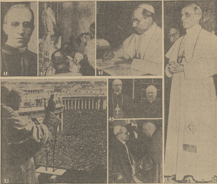
1) W 1936 roku, kiedy Kardynał Pacelli był papieskim sekretarzem stanu, 2) pakujący srebrnym motykami do drzwi Bazyliki św. Piotra podczas inauguracji 1950-go Roku Świętego; 3) podpisujący dokument Wniebowzięcia Najświętszej Panny w roku 1950; 4) błogosławiący niezliczone tłumy na placu św. Piotra podczas uroczystości wielkanocnych w 1954 roku; 5) Górna zdjęcie przedstawia Kardynała Pacelli'ego (z lewej strony) z Ks. Prałatem Franciszkiem Spellmanem podczas wizyty w Stanach Zjednoczonych w roku 1936. 5) U dołu Kardynał Franciszek Spellman składa hołd Papieżowi Piusowi XII w Watykańskim Mieście w 1953 roku; 6) Papież udzielający specjalnej audiencji w Watykanie w roku 1958.