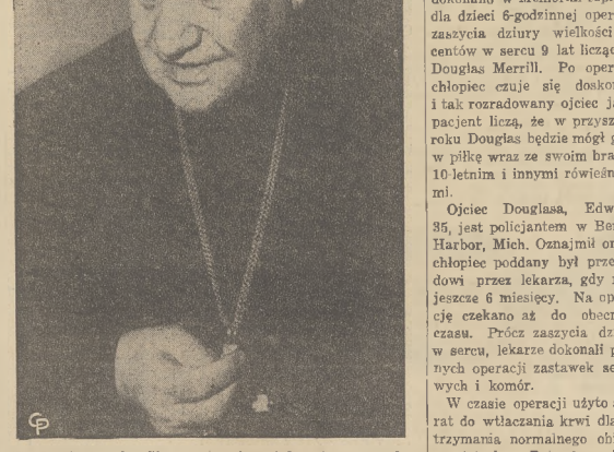
Kardynał Angelo Giuseppe Roncalli, jeden z 13-ga dzieł robotnika farmerskiego w Włochach, a ostatnio Patriarcha Wenecji został następcą zmarłego Papieża Piusa XII-go. Jest on pierwszym Papieżem Janem od roku 1334-go.