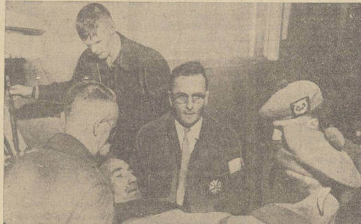
Zdjęcie przedstawia jednego z górników ocalałych w katastrofie kopalni węgla powstałej w skutek trzęsienia ziemi w Springhill, Nowa Scotia.