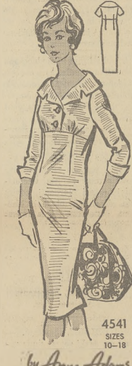
Sheath fason w nowym Empire stylu. Drukowane instrukcje.

Nr. 4541 przychodzi w rozmiarach 10, 12, 14, 16 i 18. CENA MODELKA 50 CENTÓW.