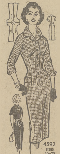
4592 SIZES 10-20 by Anna Adams

Popularny step-in fason. Drukowane instrukcje. Nr. 4592 przychodzi w rozmiarach 10, 12, 14, 16, 18 i 20.