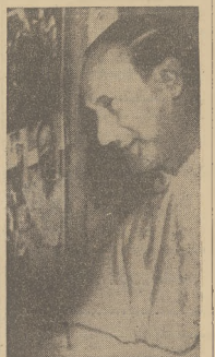
OO. Georges Pire

Po wojnie był on głęboko liczonej obojętnością licznych państw na dole uchodźców, których nie chciały one przyjmować, z powodu ich wieku czy kalectwa. Złożył on wtedy "Pomoc dla DP", później pięć "europejskich miasteczek" dla uchodźców. Ostatnie z nich pod Spiesen, w zachodniej Niemczech, nazwał imieniem poprzedniego laureata pokojowej nagrody Nobla, Alberta Schweitzera. Miasteczko Aune Frank ma być szóstym.