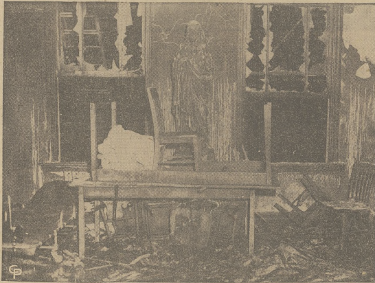
Na zdjęciu gruzy spalonej szkoły parafialnej w Chicago w której pozostała na straży samotna, zniszczona ogniem statua Chrystusa.