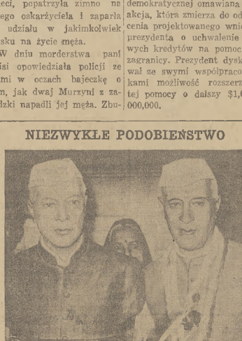
Na zdjęciu z prawej, premier Indii Jawaharlal Nehru stoi obok własnego popiersia, które jest uderzająco podobne do niego.