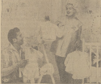
Mickey Hargitay i Jayne Mansfield w oczekiwaniu na "boćianą", zapamiętali się już w garderobie i pokój dziecięcy w ich domu w Hollywood, Calif.