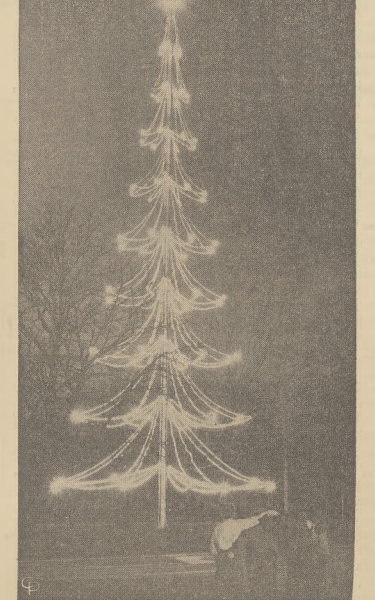
W 25 pokazie oświetlenia świątecznych Bożego Narodzenia firmy General Electric's w Nela Park, Cleveland, Ohio, wystawiona była największa w świecie choinka wykonana przez człowieka. Kolory 30,000 świateł choinki zmieniają się na oczach widzów. Przeszło 500,000 automobilistów przejeżdża rok rocznie przez tę "krajną baśń".

się będzie trumienka z relikwiami św. Wojciecha. Odnowienie przastarej Katedry odbywa się przy wydatnej pomocy funduszy rządowych, przeznaczonych na konserwację zabytków historycznych.