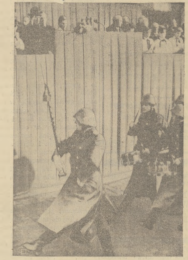
Na zdjęciu w lewo Walter Ulbricht salutuje maszerującemu w defiladzie Armii Ludowej wschodniego Berlina. Premier wschodnich Niemiec powiedział, że "jeden wystrzał w Berlinie mógłby wywołać nową potęgę wojny światowej".