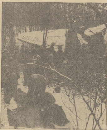
Prywatny samolot pasażerski roztrzaskał się podczas burzy śnieżnej w lesie koło North Smithfield, R. I., powodując śmierć siedmiorga osób.