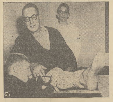
Senator Estes Kefauver (D-Tenn.) podczas udziału w wyścigach młodzieżowych w "soapbox", które odbyły się w drugi dzień świąt Bożego Narodzenia, uszkodził nogę w kolanie i nadwyrzyżył ścięgno.