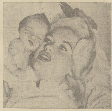
Aktorka Jayne Mansfield tuli się do swego nowonarodzonego synka w szpitalu St. Joseph, znajdującego się w