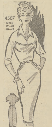
4507 SIZES 12-20 40-42 by Anne Adams