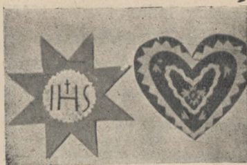
Gwiazdka i pierniczek.

my dużo ich na nitkę, nabieramy paciorek złoty, przewlekamy nitką na spód, łączymy nicią z kółkiem zielonym związujemy i przyklejamy do złotego koła. Różyczki takie robimy po obu stronach koła. Wisiorzy robimy albo z paciorków ze słomką — albo paciorki złote z paciorkami papierowymi jak to było omawiane w numerze Nr. 14-tym „Młodej Matki“, gdzie również jest model motylka na choinkę — zrobionego z tychże paciorków.