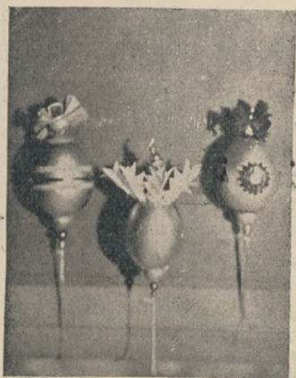
Wydmuszki z jajek.

Kółko z różyczką jest ładnym wisiorkiem. Z brystolu tniemy koło, zabkujemy — złocimy po obu stronach. Wycinamy kółko zielone z glansowanego papieru — zabkujemy również. Robimy z bibułki dowolnej barwy, najładniej mocno różowej, szereg krążków nacinamy je, zbiera-