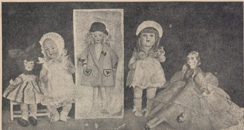
Dwie lalki oddaję dla ociemniałych dzieci w Laskach!!

Święta Bożego Narodzenia poza swem doniosłym znaczeniem religijnym, są jednocześnie wielką uroczystością rodzinną, świętem dobroci i radości, są chwilą wzmożenia i skupienia uczuć tkliwych, ciepłych, najlepszych. — Pragnęło-by się, aby w tym dniu wszystkim było dobrze i wesoło, aby nikt nie miał już trosk i zmartwień, i aby pogoda i radość zagościły wszędzie. — Z wigilją Bożego Narodzenia łączy się dawna tradycja wzajemnych życzeń i upominków. — Pamiętamy szczególnie o naszych dzieciach, dla których stroimy drzewko i które obdarzamy hojnie.