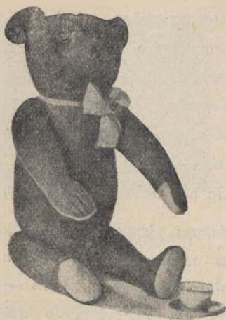
Miś będzie niezawodnie ulubieńcem działwy z Lasek.

świecie roziskrzonych świeczek, ujrzą tę zabawkę lub książkę, o której dawno marzyły. — Będzie im dobrze radośnie i dziwnie uroczyście na duszy.