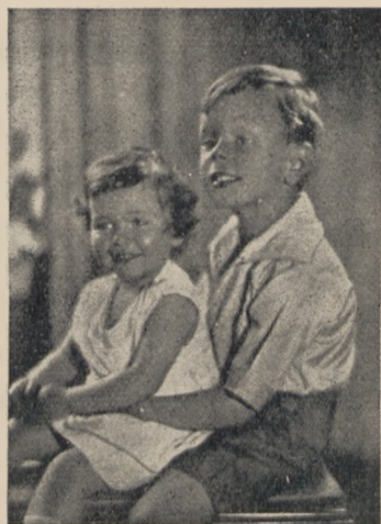
Myśmy już wybrali zabawki dla ociemniałej działwy w Zakładzie w Laskach!!

Oczywiście impuls do tej troski dać muszą starsi. — Opowiedzmy naszym synkom i córeczkom o niedoli ich rówieśników, o tych dzieciach chorych lub biednych, których szarego życia nie rozjaśni nawet dzień Wigilji. — Zaproponujmy, aby nasze dzieci ofiarowały coś ze swych zabawek dla biednych na Gwiazdkę. Wspólnie przejrzyjmy ich skarby i podsuńmy im myśl oddania tego lub innego przedmiotu. — Naturalnie nie należy zmuszać dzieci do pozbywania się ulubionych zabawek; przeznaczmy do oddania te rzeczy, które przestały je bawić i interesować, a i takich zabawek napewno znajdzie się dużo.