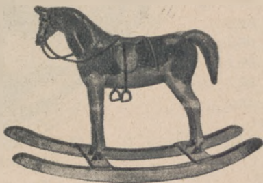
Koń na biegunach — to marzenie ociemniałych chłopców w Laskach.

Już na długo przed Gwiazdką jasne i ciemne główki myślą i marzą, co im przyniesie Aniołek lub Śty Mikołaj, albo poprostu, co im dadzą rodzice. — Myślą o tem i są pewne, że jednak zawsze coś dostaną. — Wiedzą, że przyjdzie moment, gdy w