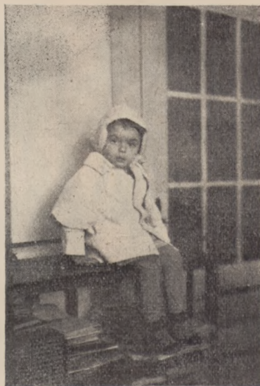
Ubranko z haftem z okolic Tlumacza.

Przyczepka przyszyta wewnątrz krytym ścięgiem, ściągnięta jest przy rączce na gumkę, szeroką na pół ctm. Trzeba jednak uważać, by gumka nie była za ciasna i nie tamowała obieg krwi przy rączce.