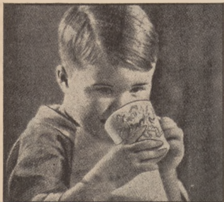
Piję z mego kubka. . .

Dziecko pod koniec drugiego roku życia zaczyna pić już z kubka. Narazie podaje mu go matka — potem rączki podnoszą same do ust kubek, a nosek i oczka zdają tonąć w jego wnętrzu. Wówczas dziecko nie chce nawet słyszeć o karmieniu łyżeczką — uważa to za pewnego rodzaju dyshonor.