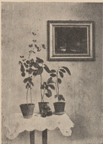
Ogródek dziecięcy w pokoju.

Każde mieszkanie, choćby najskromniejsze, nabiera uroku i wdzięku, gdy zdobią je kwiaty. Zamiatowanie do kwiatów tkwi w duszy ludzkiej od zarania życia, bo każde dziecko zaledwie chodzić zaczęła, cieszy się kwiatem.