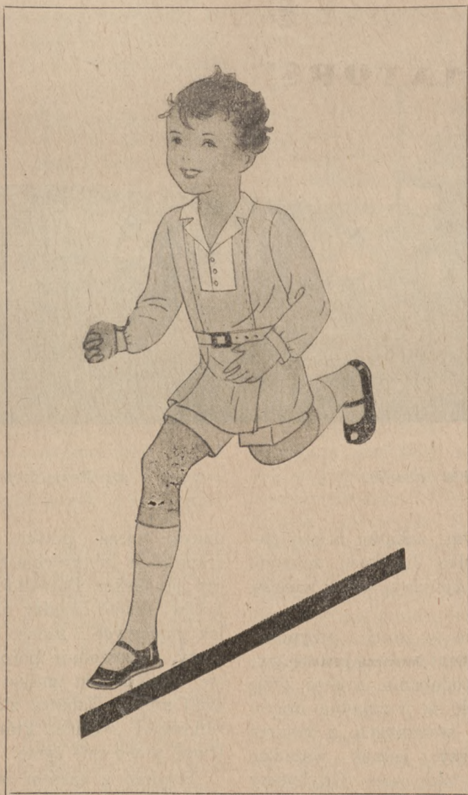
1. Ubranko dla chłopca od lat 4-ch—z flory lub welwetu do prania.

TREŚĆ: Zdobnictwo wśród dzieci. — Mody. — Jak prać białe paltociki, futerka i kapelusiki. — Nasza forma.