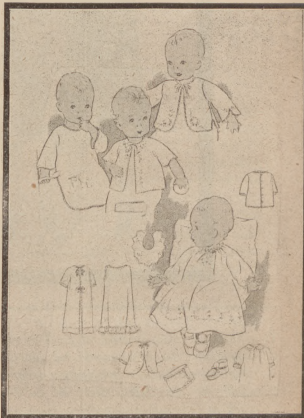
5. Kaftaniczki, fartuszki, sukieneczka dla niemowląt do 1-go roku życia.