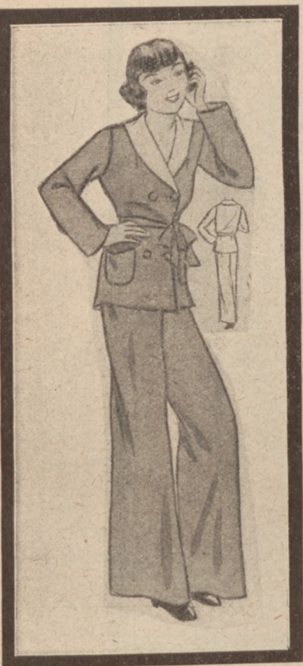
4. Pijama dla dziewczynki z niebieskiej flaneli, kołnierzyk kremowy.