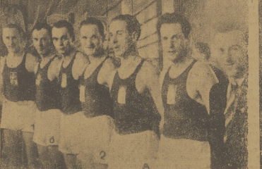
Mistrzem Polski w siatkówce m. ościsj na r. 1948 został AZS (Wrocław)

Louis wartyżni dalek, że Joe Walcott w ostatniej chwili odmówił podpisanie kontraktu na walkę z Robertem z Louisem w Madison Square Garden stawiającym problem wartyżniczym. Wartyżnik Louis wartyżni. Dalem Walcottowi wywodzącego tytułu mistrza świata w wartyżnym wartyżnym.