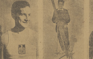
Piłkarski (AZS Warszawa) był najlepszym zawodnikiem mistrzostw Polski w siatkówce.