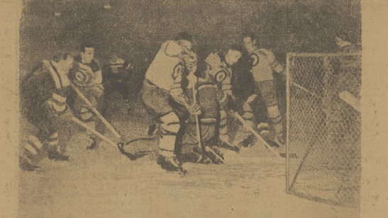
Fragm. z meczu hokejowego CSB — Kanada 3:3 w Pradze. Za mieszanie pod bramką czeską.