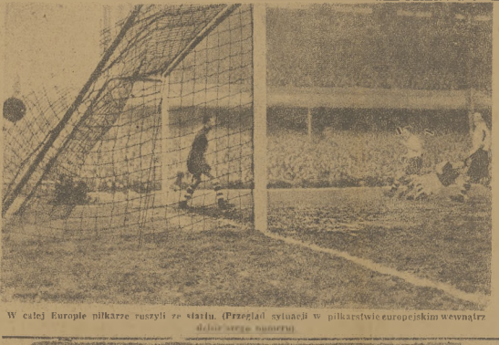
W całej Europie piłkarze ruszyli ze startu. (Przebieg sytuacji w piłkarstwie europejskim wewnątrz Wielkiej Brytanii)

Nr. 17 (303) KRAKÓW - KATOWICE - WROCŁAW, 26 [lutego 1948 r.