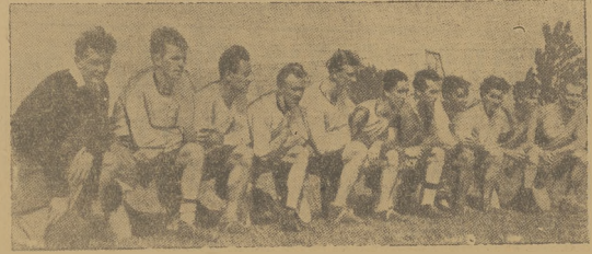
„Bakterowic” kopenhaskiego Ledanu przed pogromem

W niedzielę dała 4 m. obkopczona się drugo runda rozgrywek o wjeście do klasy A w grupie karkowskiej. Zabianka, która walczyła ma już zapewnione mistrzostwo klasy B, zdobyła bodie na swoim boisku Zabianka, która pokonała w pierwszym kole 4:2. Następną spotkanie odbyła się 11 m. Ełbowianka — Wolania 1:4 m. Wilania — Bia-znowianka.