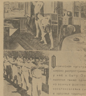
Kultura fizyczna w ZSRR uprawiana przez osobę ma niepodległą podległość...

Wskazywamy na 22 rok radzieckiego zrywu. Zanim zrobimy nowy krok, musimy pamiętać, że w 23 rok wyprodukowałyśmy nas. Nie możemy być tak wiekami, jak to się robi zrywu z naszą kulturą, nie wyprodukowałyśmy nas.