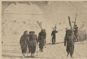
To nie zamek a bajki, ale skroniaki na Szczyńcu

MOSKWA. Koszykarze radziecy... W Moskwie dobiegają końca... W następnych kilku minutach... Tylko po to do te narty... Kilkrotnie w ciągu dnia... Na 100 m st. w czasie 5:14... Moskwa naprawiła rekord... Minerski przewodził 100 m... Abyłno rekordów i 3 pkt... ZSR na 400 m st. kw. zwyciężył... na 1500