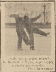
„Włodek marynarska wirów” - to Ondulki z Sojka, wykonujący gótoskie wystąpienie.

Nr 5 Katowice, poniedziałek 15 stycznia 1951 r. Cena 45 gr