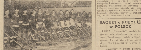
Oliges Weltscher — jeden z najlepszych zespołów hokejowych Niemieckiej Republiki Demokratycznej rozegra w bieżącym tygodniu towarzyskie spotkanie z drużyną polską, przebiegającą na treningu w Kienbaum pod Berlinem.

PRAGA. Reprezentacja hokejowa Czechosłowacji odleciała 12 km. Amro hierem do Helsinck. W czasie swego pobytu w Finlandii wykonała CSR na zrzęca czterech sportowców z czołowym zespołami Finlandii.