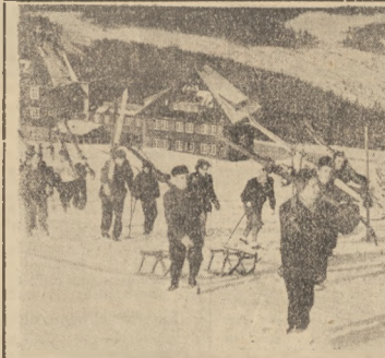
Hala Szczyńska jest doskonałym terenem dla narciarzy i narciarek

Wielki Mi nowy regulamin sportowy... domandrowni, jak dwoje, do za... Regulamin dotyka następujące ka... kuracja w narciarstwie: