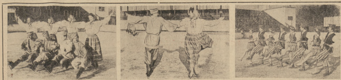
Kozak nucił do najtrudniejszych numerów rewii. Studencka i Sojka stanowią doskonałe spręż parę w tańcu parowym. Krakowianin w wykonaniu odświeżonego zespołu.

KATOWICE. Hokeiści Stali znowu zwyciężyli. W tym meczu zwyciężyli 15:1 (2:0, 8:0, 5:1). Unik reprezentowana była przez klubowy zespół z Wyr podległy Stali reprezentowana była przez zawodników klubów Katowice, Steniewice, Sianowice i Biadka. Do kompletnego zespołu reprezentacji Stali brak było jednego zawodnika. Pokonani doprowadziły tylko 8 zawodników zespołu Stali, zwyciężyli oni do dwójki 11:3. Niezdolności, że zawodnicy Stali oparli na ataku już po pierwszej tercii a w drugiej i trzeciej tercii nie udało się na atak. Właśnie w ten sposób zdobył Goci i Wajdowski po 2. i 3. minucie. W 1. minucie zdobył Goci, w 2. minucie zdobył Goci, w 3. minucie zdobył Goci, w 4. minucie zdobył Goci, w 5. minucie zdobył Goci, w 6. minucie zdobył Goci, w 7. minucie zdobył Goci, w 8. minucie zdobył Goci, w 9. minucie zdobył Goci, w 10. minucie zdobył Goci, w 11. minucie zdobył Goci, w 12. minucie zdobył Goci, w 13. minucie zdobył Goci, w 14. minucie zdobył Goci, w 15. minucie zdobył Goci.