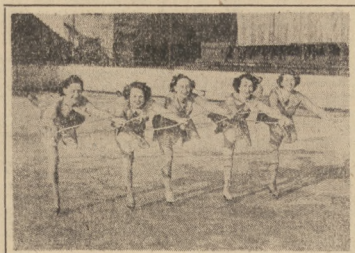
Wale stylizowany w wykonaniu pięciu czołowych łyżwiarek Stali. W. Arkada Ziętewa.