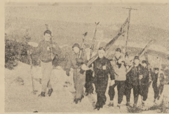
Na zwyciężce narciarskiej