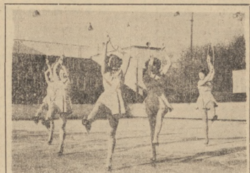
I jeszcze raz to samo piętko w walcu.