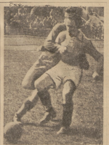
Zwycięzca fair walka o piłkę dostarcza publiczności wiele emocji.

Walczyli w wścigu pokoju w Warszawie—Warszawa.