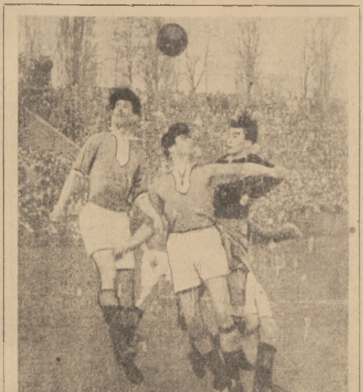
Obrotowa Opinia Kraków w akcji. Główna i Kazimierz Młody. Trzymają. Fragment z meczu Opinia Bytom — Opinia Ursula 1:1