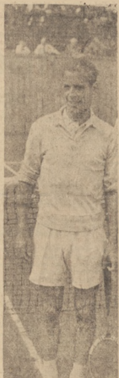
Widziałem Skonecki wygrany chwila pog. spodyczna, przegry- ł się wrócił do szwajcarskiej Polki w meczu ze Szwajcarią

Za to jak się rzecz miała: — Zaczęliśmy meż o godz. 15.15. Piątek wystrzelił raczej słabo — opowiada inz. Olszow- ski. (Ciąg dalszy na str. 2)