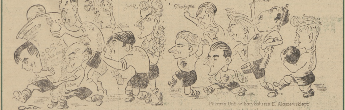
Piłkarze Unii w karykaturze E. Alaszewskiego