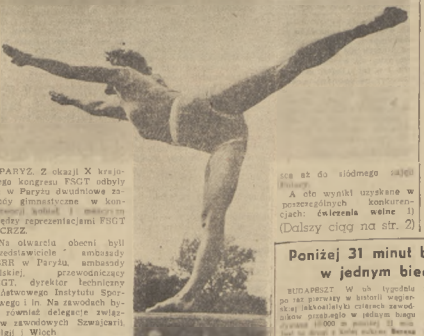
Wystawienie rekordów świata... Zwycięstwa gimnastyków polskich w Paryżu