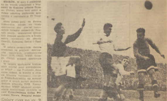
Kraków. W szarych płaszczykach... Dynamo Tbilisi w Krakowie