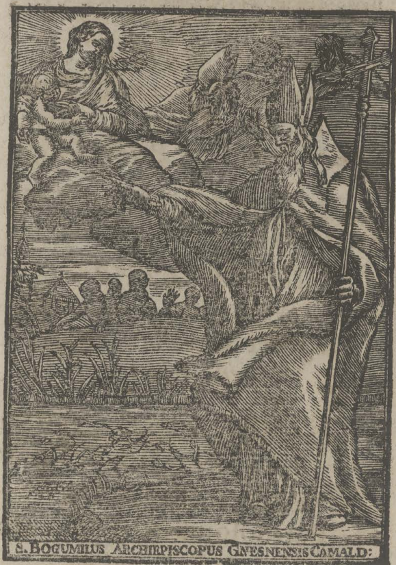
E. BOGUMILUS ARCHIEPISCOPUS GNESNENSIS CAMALD:

Dum facilis pro Te miseris fert alveus escam Influis æternas, sic Bogumile dapes.