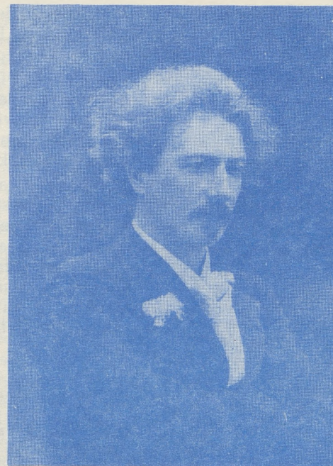
IGNACY JAN PADEREWSKI 1860 - 1941

Jan Kardynał Król Jan Kardynał Król Arcybiskup Filadelfii