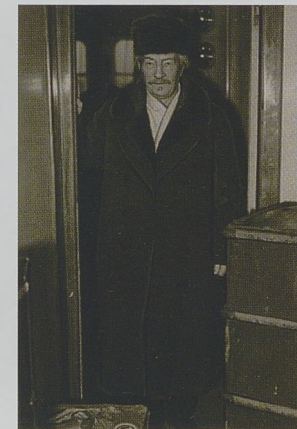
Paderewski na statku w podróży z Francji do Stanów Zjednoczonych